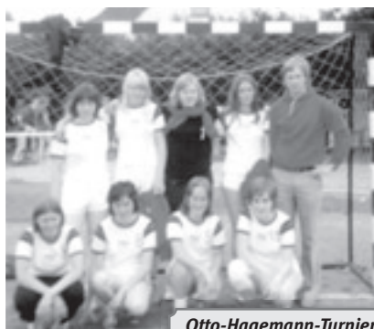
Otto-Hagemann-Turnier 1975 w. A-Jugend