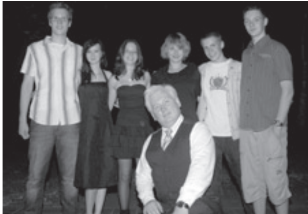
Trainer mit einem Teil der Jugendgruppe

der Sache. Die Jugendlichen wollten sich aber nicht so lange binden – deshalb war dieses Angebot auf sechs Monate befristet. Wenn wir die Unterstützung aus den Schulen bekommen und sich entsprechend viele jugendliche Paare melden, werden wir selbstverständlich wieder so ein Angebot machen.