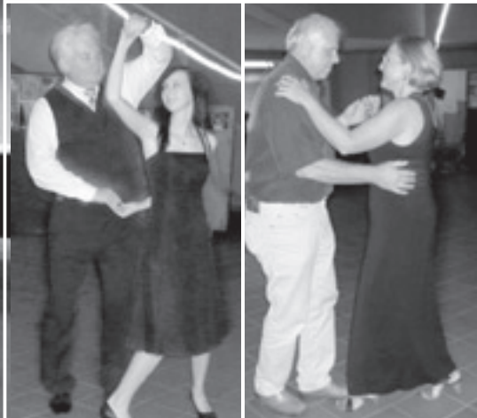
Momentaufnahmen der Jugendabschlussveranstaltung