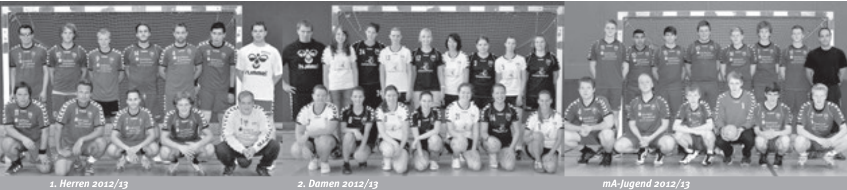
1. Herren 2012/13