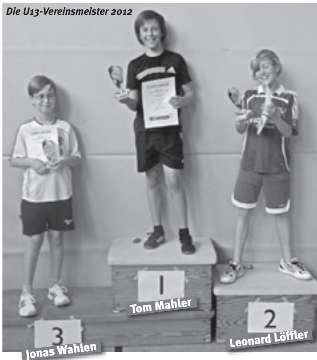
Die U13-Vereinsmeister 2012