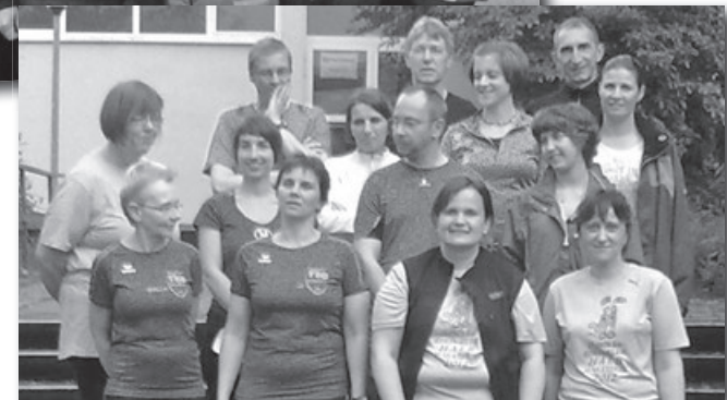
... und der Anfängerkurs 2015

Konkretes geplant, aber ihr könnt euch schon mal melden.