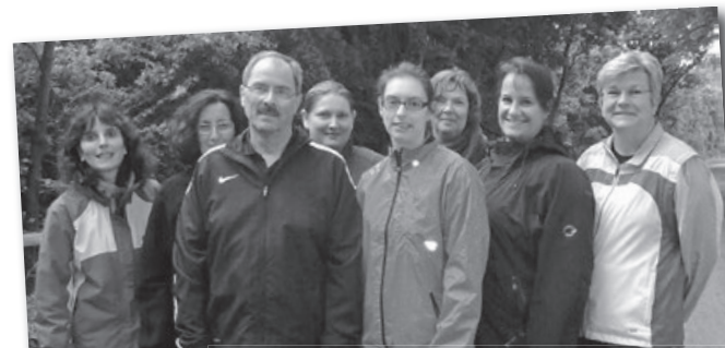
Der Anfängerkurs 2012 ...

Ein großer Wunsch von mir wäre, wenn so viele Läufer/innen, ehemalige Kursteilnehmer/innen und Treffläufer/innen wie möglich zu einer gemeinsamen 10-Jahres-Feier zusammen finden könnten. Es ist noch nichts