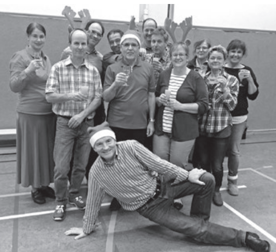
Auch zu Nikolaus wurde getanzt.

Dass Tanzen nicht nur gesund hält, sondern auch einen sportlichen Charakter beinhaltet, davon sind die Tänzerinnen und Tänzer der Tanzsportabteilung der TSG Sprockhövel voll überzeugt. Doch ist es natürlich schwierig,